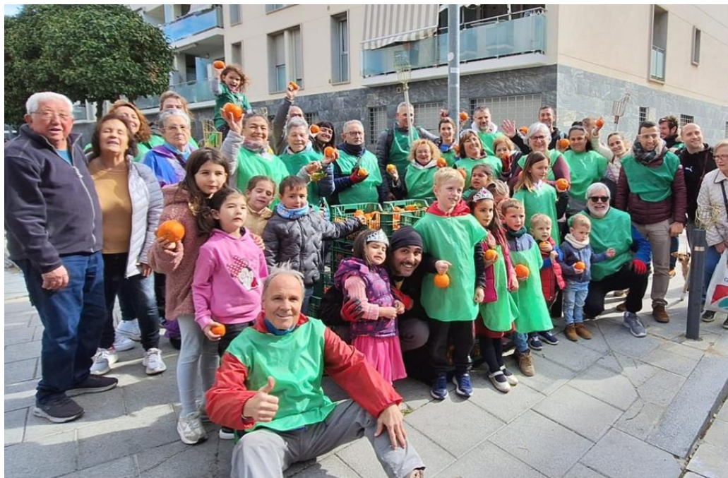
Figura 4. Participantes en la espiga de naranjos del barrio de Sales, en febrero de 2024.