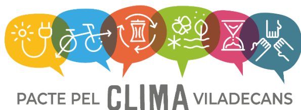
Figura 1. Marca gráfica del Pacto por el Clima de Viladecans

La presentación y celebración del Pacto a la ciudadanía tuvo lugar en un acto festivo el 20 de marzo de 2022. El Pacto proporciona una red de relaciones y un programa de trabajo conjunto para organizar esta acción coordinada. También se abrió la posibilidad de adherirse, como particular o como entidad o empresa, al Pacto por el Clima.