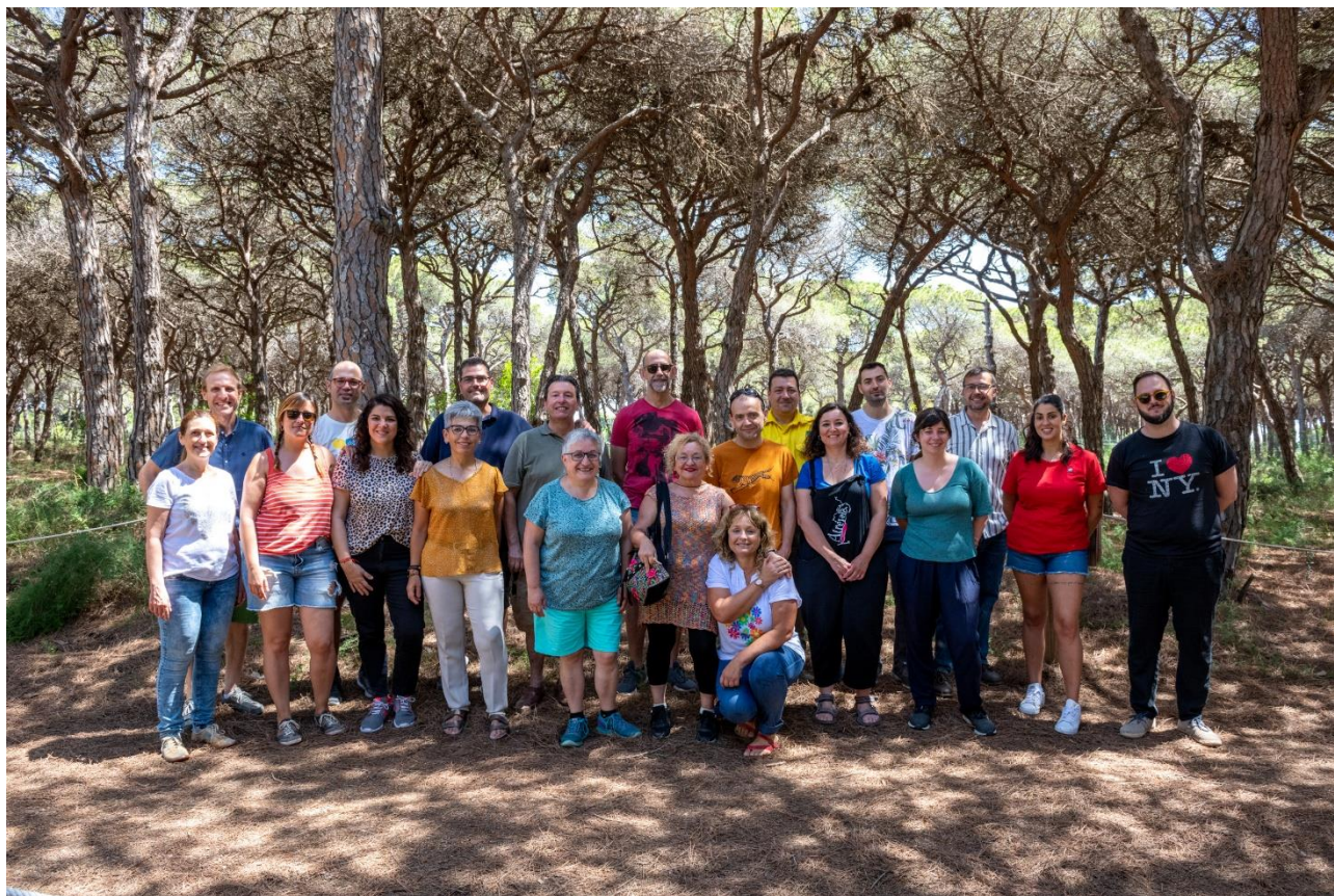
Figura 2. La Mesa local de emergencia climática, en mayo de 2022.

municipio, así como con la ciudadanía particular , para convertir el Pacto por el Clima en acciones concretas.