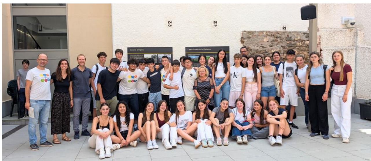
Figura 6. Encuentro de los participantes de “Joves pel Clima”, en junio de 2025.

Así, estos ApS se han enfocado durante los dos 2023-24 y 2024-25 al problema del desperdicio alimentario, sumando un total de 8 proyectos de los cuales dos se han consolidado, como son los talleres en las escuelas que también desarrollan su proyecto Jo No Llenço y la espiga de naranjos, que organizan los propios jóvenes con la ayuda del ayuntamiento.