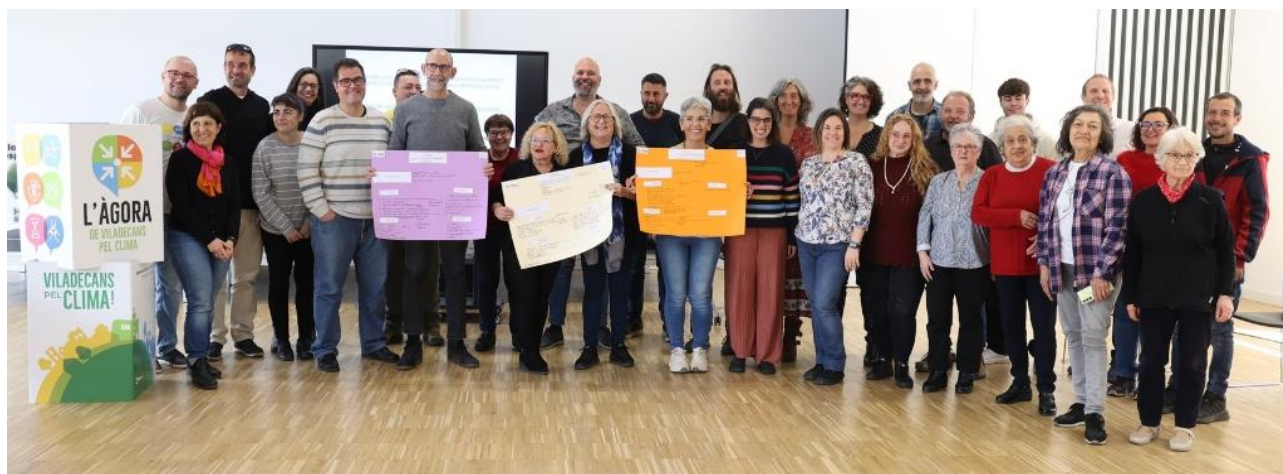
Figura 5. Participantes del Àgora de Viladecans pel Clima, en abril de 2025.